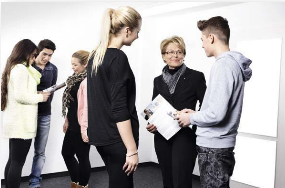
Ajutor în carieră pentru tineri; JOBLINGE gAG Ruhr din Essen, 2014