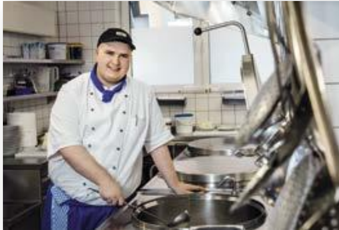
Sprijin pentru stagii pentru tineri: fost angajat, acum ucenic bucătar; Marienhaus g GmbH din Essen, 2014

pregătire sau un loc de muncă, integrându-i astfel în mod durabil pe piața muncii și în societate. Într-un program special de șase luni, dezvoltat de organizația non-profit JOBLINGE gAG Ruhr, participanții învață ce profesie li se potrivește, care sunt punctele lor forte și cum se aplică în mod corespunzător. Programul de instruire bine conceput al JOBLINGE s-a dovedit foarte eficient de-a lungul anilor, iar inițiativa a ajutat peste 70% dintre participanți să își găsească un loc de muncă. Aceasta înseamnă că majoritatea participanților la program intră cu succes pe piața obișnuită a muncii.